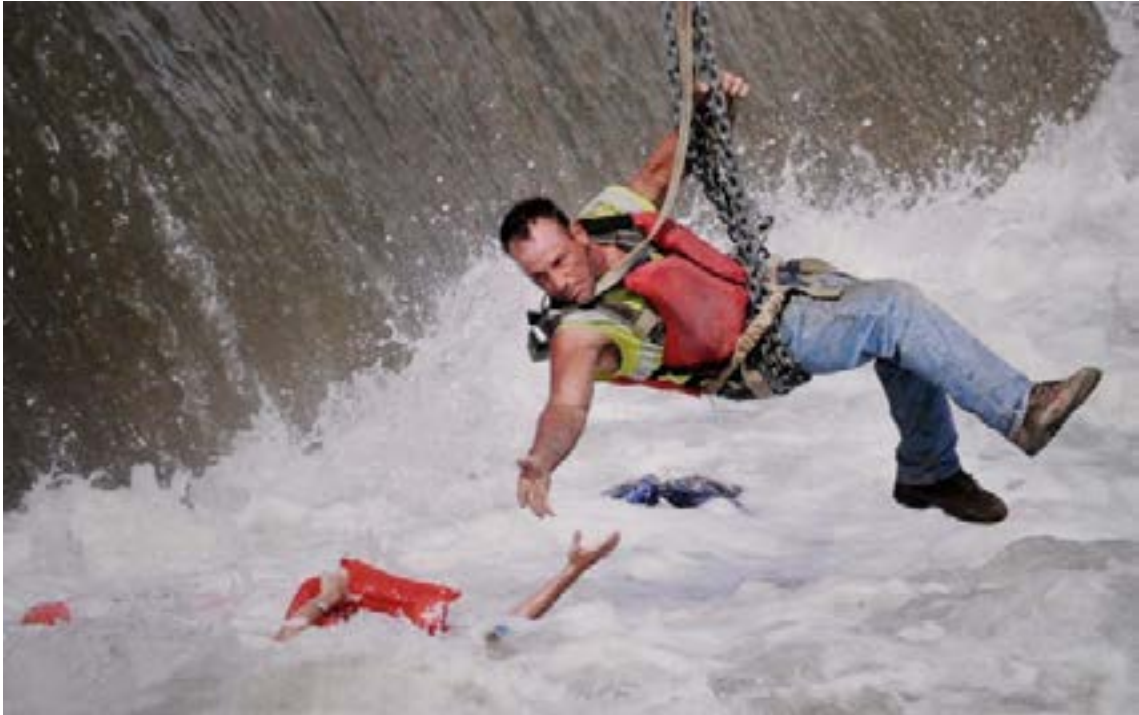
Fotoğraf 4. Bir İnşaat işçisinin Nehirde Boğulmak Üzere Olan Bir Kadını Kurtarmaya Çalıştığı An (Tarih: 1 Temmuz 2009, Yer: Des Moines, Iowa, ABD)