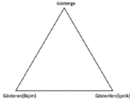
Şekil 1. Roland Barthes'ın Gösterge Şeması (Demirel, 2023).

Göstergebilime Saussure'ün ciddi anlamda katkıları olsa da göstergebilime daha çok görsel öğeler üzerinden bir yaklaşım geliştiren kişi Roland Barthes'dır. Barthes'ın göstergebilimi, imgeler, göstergeler ve bu göstergelerin içerdiği anlamlardır. "Gösterenin gösterilene belirttiğini ifade eden genel dilbilimin aksine Barthes (1990, s. 158), her türlü göstergesel dizgede üç farklı terimden bahsetmektedir. Bunlar; kendilerini birleştiren bağıntılara sahip gösteren ile gösterilen ve bu iki terimin çağrışımsal toplamı olan göstergedir" (Demirel, 2023, s. 5).