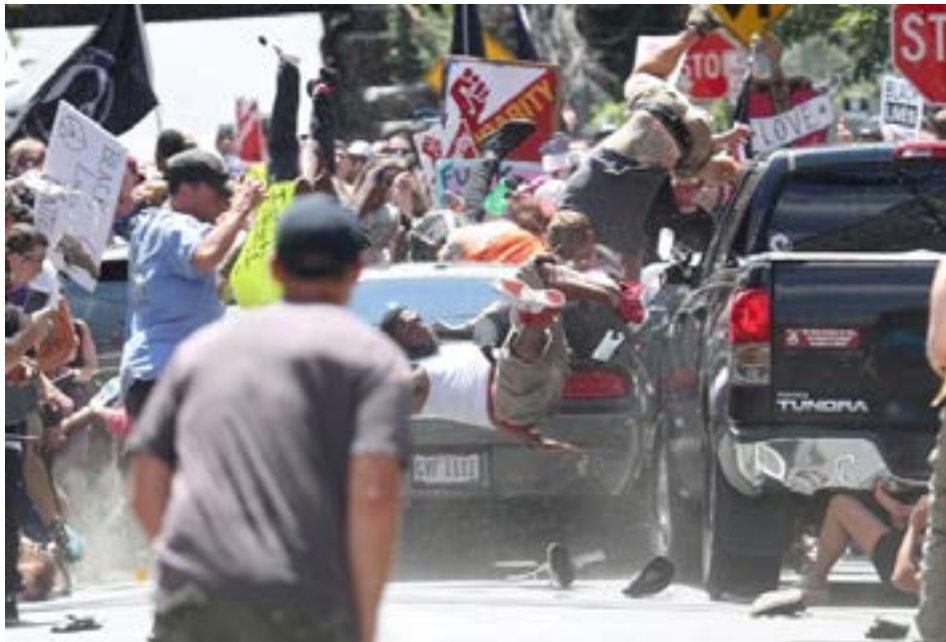
Fotoğraf 5. Irkçılık karşıtı bir protesto sırasında karşıt görüşlü birinin arabayla göstericilere saldırı anı (Fotoğrafçı: Ryan Kelly / The Daily Progress, Tarih: 12 Ağustos 2017, Yer: Charlottesville, ABD)