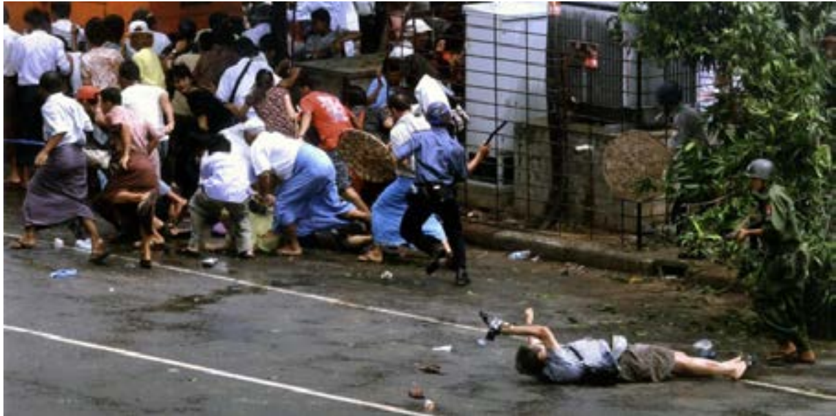
Fotoğraf 3. Myanmar'daki Bir Sokak Gösterisi Sırasında Ölümcül Şekilde Yaralanan Japon Bir Gazetecinin Yola Savrulması (Tarih: 23 Eylül 2007, Yer: Yangon, Myanmar)