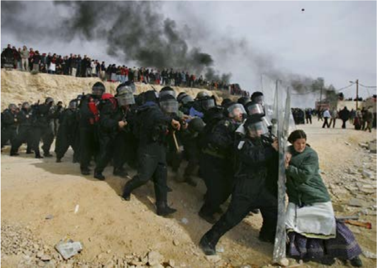
Fotoğraf 2. Bir Yahudi Kadının Batı Şeria'daki Yasadışı Yerleşimcileri Uzaklaştıran İsrail Güvenlik Güçlerine Meydan Okuması (Tarih: 1 Şubat 2006, Yer: Batı Şeria, Filistin)