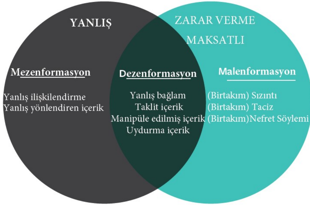
Şekil-1: Enformasyon Bozukluğu.

Şekil-1’de enformasyon bozukluğunun üç türünün (mezenformasyon, dezenformasyon ve malenformasyon) birbiri ile ilişkisi ve kesiştikleri alanlara yer verilmiştir (Wardle ve Derakhshan, 2018: 44). Wardle (2019a) ise enformasyon bozukluğu kapsamında yer alan dezenformasyon, mezenformasyon ve malenformasyonun içerisinde bulunduğu karmaşık ekosistemin daha kolay kavranabilmesi için yedi kategori ve zarar düzeyi belirlemiştir. Bunlar (1) Uydurma içerik, (2) Manipüle edilmiş içerik, (3) Taklit içerik, (4) Yanlış bağlam, (5) Yanlış yönlendirici içerik, (6) Yanlış ilişkilendirme ve (7) Hiciv veya parodidir (Şekil-2).