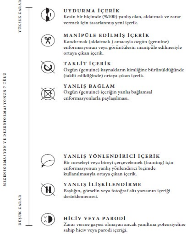
Şekil-2: Mezenformasyon ve Dezenformasyonun Yedi Türü [Kaynak: Wardle, 2019a: 10-11].

Bu kapsamda sıkça kullanılan bir başka kavram ise yine gerçeği yansıtmayan veya gerçeğin çarpıtılmış, zedelenmiş halini tanımlamak için kullanılan ‘yalan haber’ (fake news)’dir. Wardle ve Derakhshan, ‘yalan haber’ teriminin –herhangi bir biçimde- iktidarda bulunan bireylerin hoşlarına gitmeyen haberleri baltalamak için veya politize ederek haber medyasına karşı kullanılan bir terim olduğuna dikkat çekmekte, bu nedenle ‘yalan haber’ yerine dezenformasyon ve mezenformasyonun kullanımını tercih ettiklerini belirtmektedir (2018: 43). Allcott ve Gentzkow sahte ya da yalan haberi kasıtlı ve doğrulanabilir şekilde yanlış olan ve okuyucuları yanlış yönlendirebilecek haber metinleri olarak tanımlarken (2017: 213), Klein ve Wueller ise bilerek veya kasıtlı olarak yanlış ifadelerin çevrimiçi yayınlanması olarak tanımlamaktadır (2017). Son tahlilde Lazer ve ark.’na göre sahte haber, mezenformasyon ve dezenformasyon gibi diğer bilgi bozuklukları ile benzerlik taşımaktadır (2018: 1094). Hali hazırda, ‘haber’ gerçekliği içerisinde barındıran bir kavram olduğundan ‘yalan’ nitelemesiyle birlikte kullanımı bir oksimoron yaratmaktadır (Uzun, 2020: 53). Bu nedenle çalışmada,